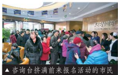
▲ 咨询台挤满前来报名活动的市民

种植牙充1000抵10000, 凭活动假牙免费换种植牙, 报名电话0531-88810555!