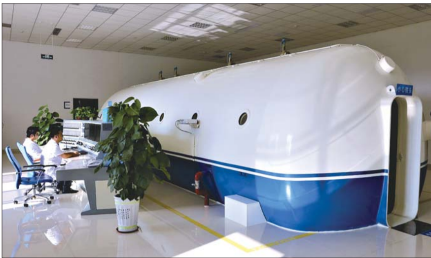
医护人员通过视频随时跟舱内患者沟通。

“今天凌晨4点多，送来了一对夫妻，当时丈夫的意识还清醒，妻子已经昏迷，他们都是一氧化碳中毒。”刘瑾瑜说，是丈夫率先感到不适，起床发现妻子已经呼叫不应，于是紧急呼叫救护车，被接来医院抢救。时间就是生命，医院第一时间给他们安排了高压氧舱治疗，在治疗到82分钟的时候，妻子意识恢复，并能分辨出丈夫及陪人，出舱后住进病房继