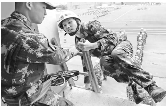
武警福建消防总队新兵在进行训练。