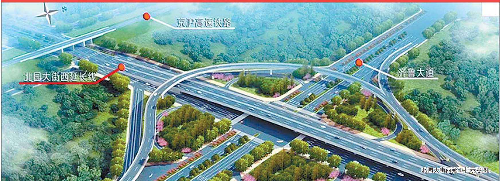
北园大街西延工程示意图。