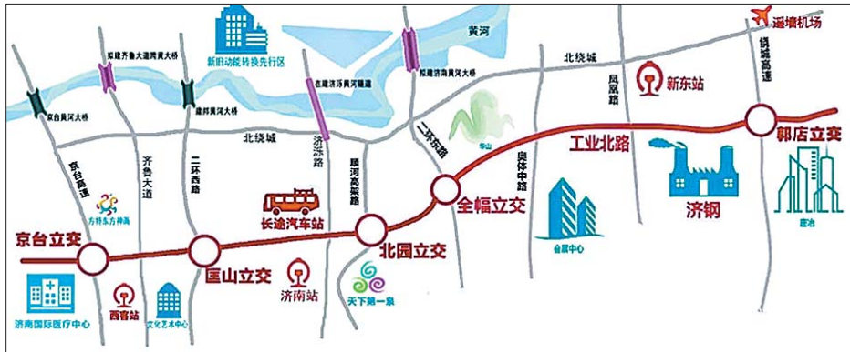
北园高架—工业北路高架将成济南首条连接高速的快速路。

12月28日,济南市交通委发布消息称,北园高架西延工程当日正式开工!工期为450天,高架为双向六车道。沿途设置四处匝道,并下穿京沪高铁线。工程还将同步建设BRT专用车道,并与轨道交通相连。建成后,北园高架路、工业北路将成为济南首条贯通东西的城市快速路,而且打造出最长的BRT走廊。