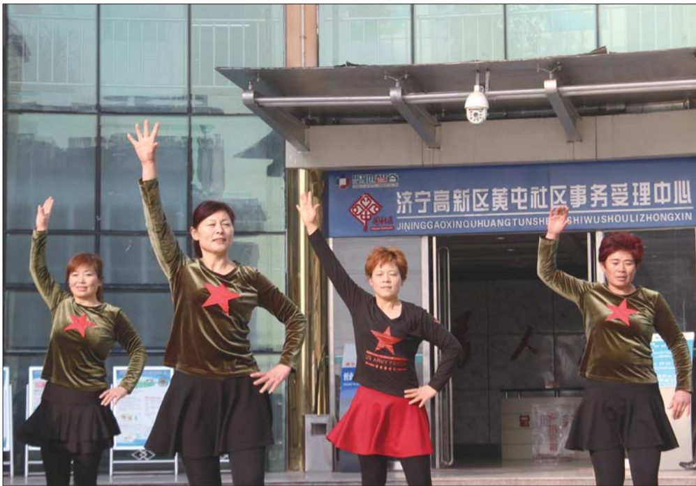
居民在社区广场上跳广场舞。