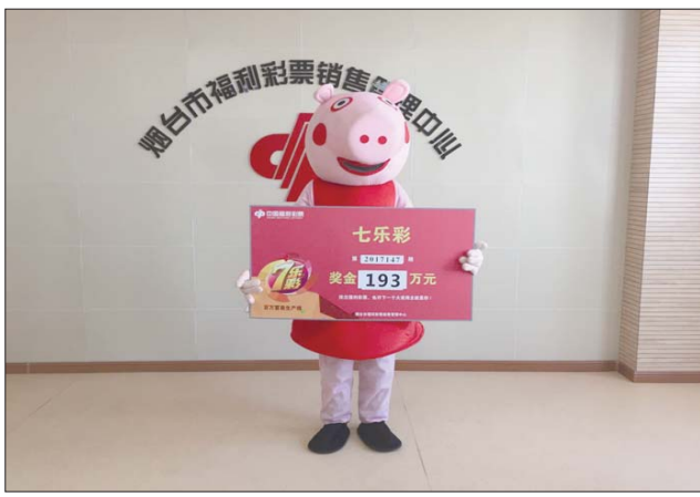
烟台彩友机选中七乐彩193万。

12月26日,烟台福彩中出双色球一等奖2注,七乐彩一等奖10注,双色球二等奖84注,刮刮乐一等奖27注。烟台福彩中心秉承“扶老、助残、救孤、济困”的发行宗旨和“取之于民、用之于民”的福彩公益金使用原则,先后资助建设了市内各级老年福利中