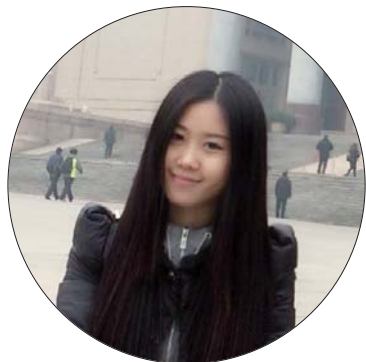
作者:王媛 荣获第二十一届中国新闻奖新闻摄影二等奖。(本年度新闻摄影一等奖空缺)

2010年11月1日,济南市廉租房实物配租开始选房。当日,共有198户家庭参加了选房。