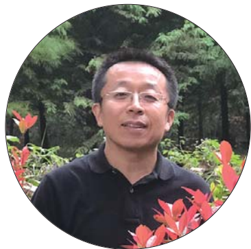
作者:邢强 荣获第九届中国新闻奖一等奖。

1998年初,有多位读者拨打读者热线电话向本报提供新闻线索,他们反映身边的亲人练了“法轮功”后,精神怪诞、健康状况也每况愈下,他们对家人这些变化感到非常担心。比如,原来靠合理用药控制的高血压、高血糖病人居然不服