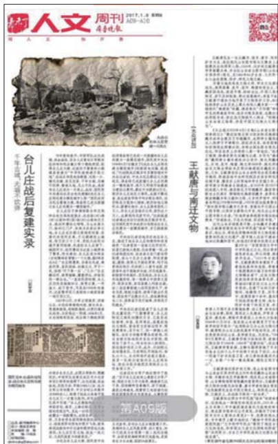
刊登本文作者稿件《台儿庄战后重建实录》的版面。

在齐鲁晚报创刊三十周年之际,感谢编辑老师对我的关心帮助,祝愿齐鲁晚报永远是报界的一棵“常青树”,我也将继续努力,在这个平台上多宣传家乡的历史文化。