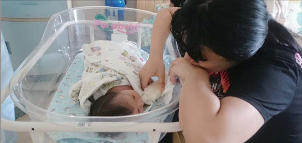
山东省立医院东院,一位妈妈正在给孩子喂奶。

“去年虽然没有前年分娩量多,但接到需要抢救的高危产妇却有350多人,比2016年增加了一倍还多。”千佛山医院产科护士长曹丹凤说,能明显感觉到产妇的年龄偏大,需要紧急处理的高危孕产妇也在增多。