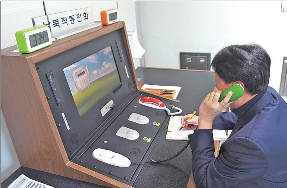
1月3日,在板门店,韩方工作人员通过朝韩联络热线与朝方联系。