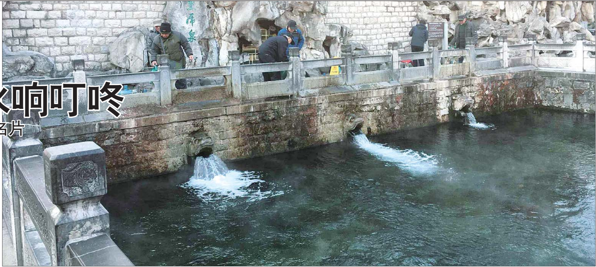
23日早晨,爱喝泉水的市民像往常一样,来到黑虎泉打水。虽然虎头仍在喷涌,但保泉形势严峻。