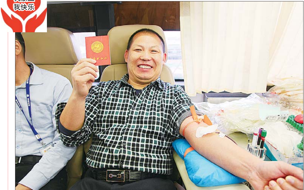
山东科普电源系统有限公司获悉春节期间省城临床用血非常紧缺，主动联系山东省献血办公室组织公司员工参加无偿献血活动。24日，山东省血液中心的献血车开到山东科普电源系统有限公司。一切准备工作完毕后，19名献血职工在血站工作人员的指导下参加无偿献血，累计献血量6000毫升。