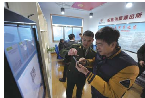
石岛中心渔港“海上党员之家”,边防官兵同海上临时党支部第一党小组的党员们共同学习党的十九大精神。