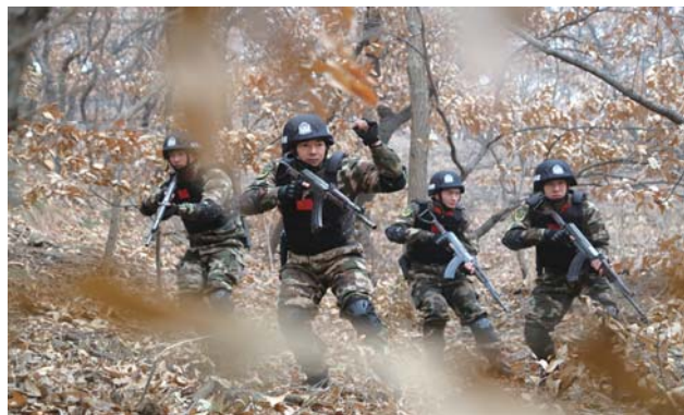
威海边防支队组织部队开展2018年开训动员暨实兵拉练活动,对标实战,锤炼部队组织指挥和遂行任务能力。

党的十九大报告指出“军队是要准备打仗的,一切工作都必须坚持战斗力标准,向能打仗、打胜仗聚焦。”为此,在深入学习贯彻党的十九大精神活动中,威海边防支队坚决贯彻落实新时代党的强军思想,强化备战打仗鲜明导向,制定维护边防辖区安全稳定的务实举措。