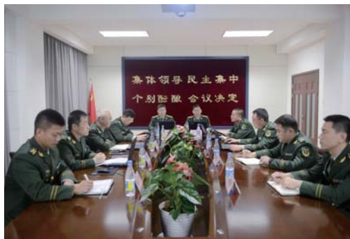
威海边防支队召开党委理论中心组学习党的十九大精神扩大会议。

为适应全媒体时代青年官兵学习十九大的不同需求,支队还利用“980之家”政治工作微信公众号推出“小兵说十九大”专题策划,