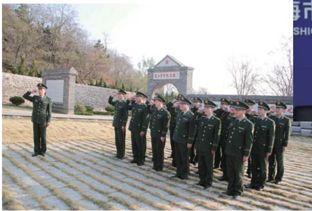
威海边防支队组织官兵到“龙山革命纪念馆”红色教育基地参观见学。缅怀革命先烈,接受革命传统教育。

“滴……滴……滴……滴”抢答器声音此起彼伏,这是边防支队正在举办的十九大知识竞赛,来自全市边防部队的7支参赛队同台竞技。各参赛队你追我赶、互不相让,现场气氛异常激烈。“我们不断丰富自选动作,抓好辅导培训、网络助学、实践教学、研讨交流等学习教育活动,确保全员培训,不漏一人,推动党的十九大精神入脑入心”威海边防支队党委书记、政委马世元。此外,该支队公安网主页、微信公众号发布十九大精神权威播报和部队学习动态等一系列活动,进一步点燃广大官兵学习党的十九大精神的热情。