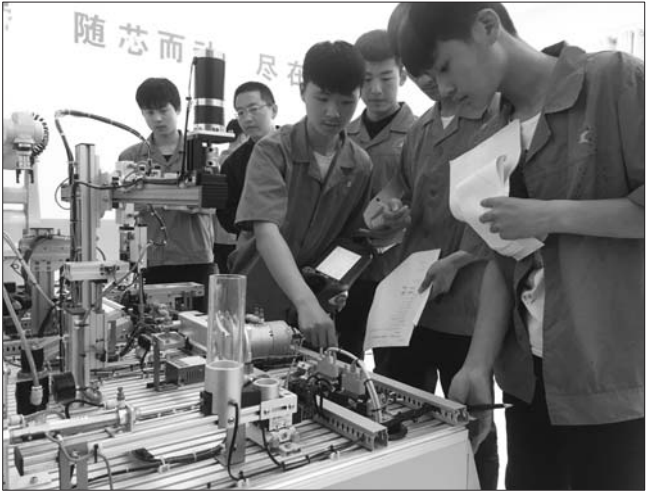
济宁工业技师学院成国家级高技能人才培训基地。

同时,做好各类工程人选选拔推荐工作,一人入选国家百万人才工程,两人被评为享受国务院颁发政府特殊津贴人员,一人入选泰山产业领军人才(产业技能类),实现了济宁市在该项目上零的突破。全年争取国家、省级人才平台、工程项目奖补资金1101.36万元,市财政投入平台建设、人才工程项目经费575万元,兑现泰山产业领军人才、省市突出贡献专家等各类人才安家补助和人才津贴446.41万元。