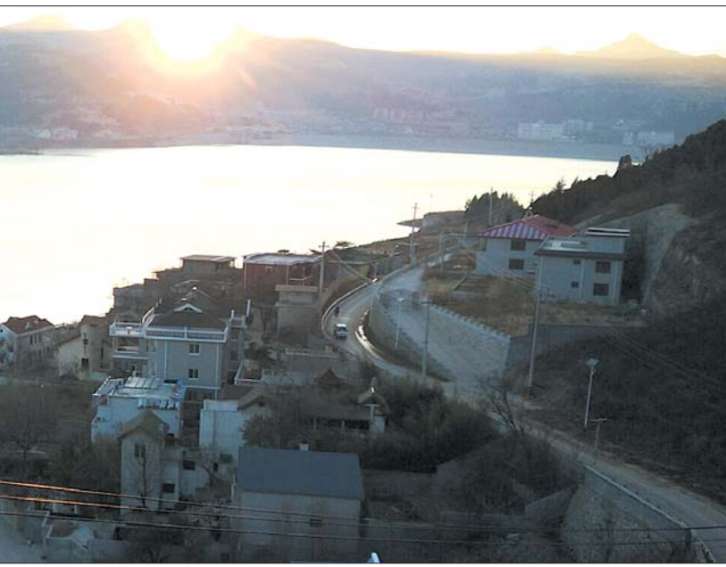
3月8日,夕阳下的卧虎山水库景色,但水库水位比同期下降。

据了解,园博园内的长清湖前身名叫东风水库,1958年开始修建,当时为山东省内最大的水库,于1962年将水库大坝爆破拆除。在1998年-2007年期间进行了多次改造,改造后,总库容888万立方米,防洪水位54.51米,兴利库容675万立方米,水面面积1440亩。东风水库当时维修后就叫景观湖,再后来通过改名改为长清湖。