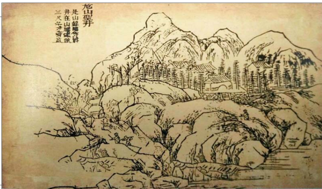
▲ 清道光十三年《章丘县志》描绘的章丘八景之一“危山圣井”