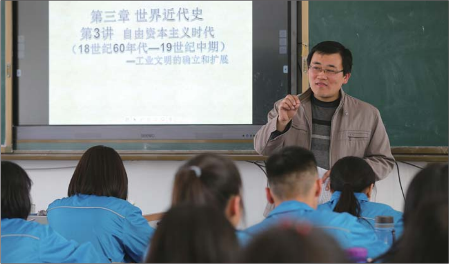
一位老师正在为学生们上课。

英才高级中学副校长李耀立说,在对学生的评价方式上,我们把重心由“个体评价”转向“小组评价”,这样既能形