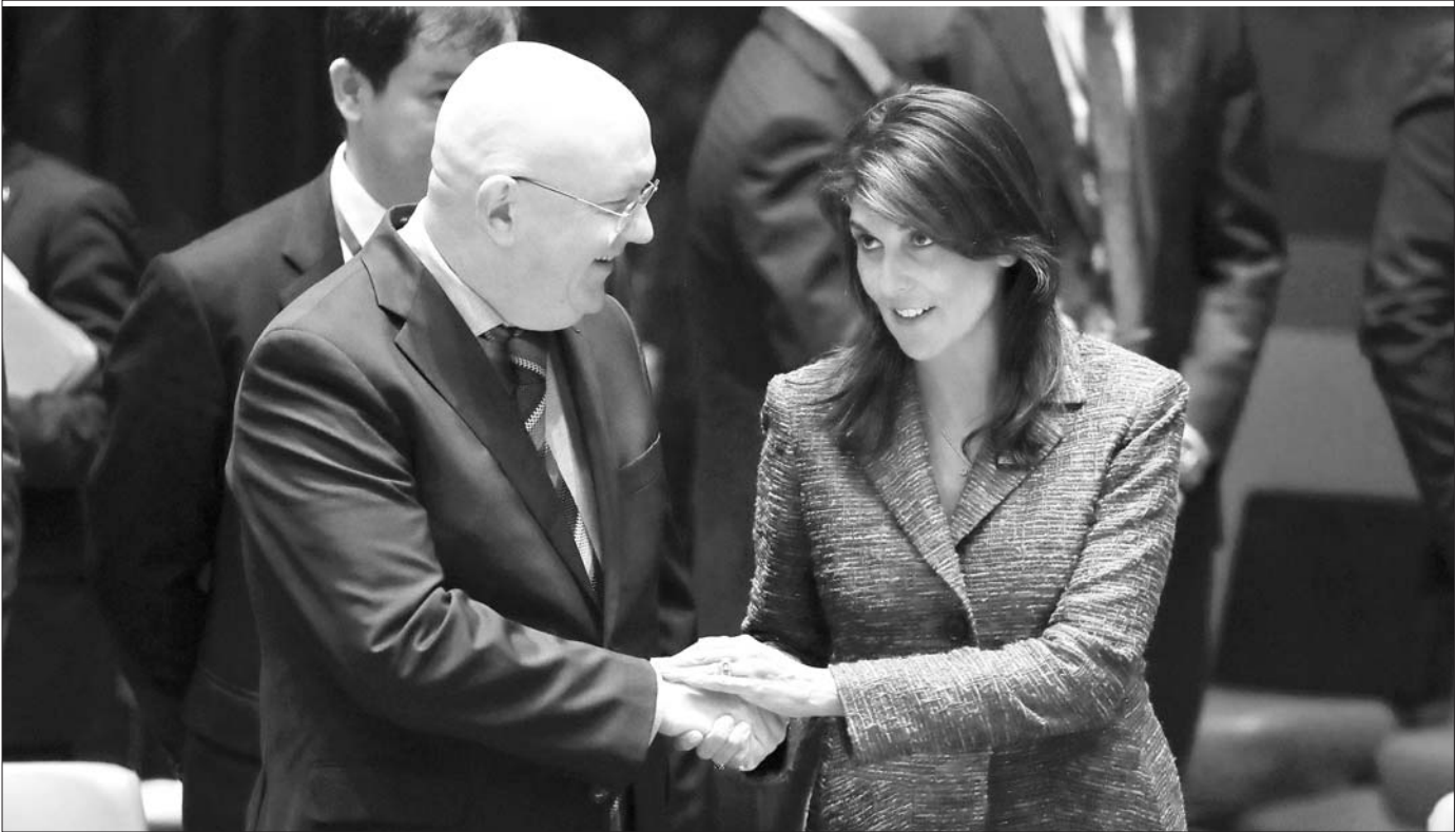
4月10日，联合国总部，美国代表黑莉(右)和俄罗斯代表涅边贾在出席安理会会议前握手。

围绕叙利亚反对派控制地区疑似遭化武袭击事件，美国10日拉拢英法等盟友，酝酿对叙利亚采取联合行动，与俄罗斯的紧张关系进一步升级。当地时间11日，特朗普突然在推特上发言：“俄罗斯请准备好吧，因为导弹马上就来。”这一发言可能意味着，美国已经决定武力应对该危机。