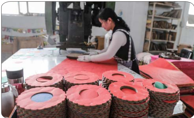
用机器压出拉花的花型。