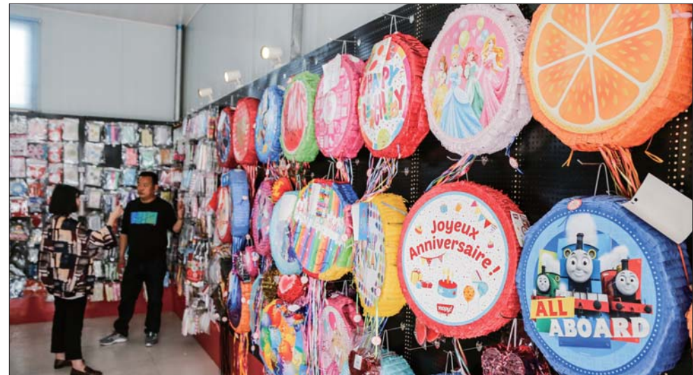
拉花和派对用品融入不少时尚元素。