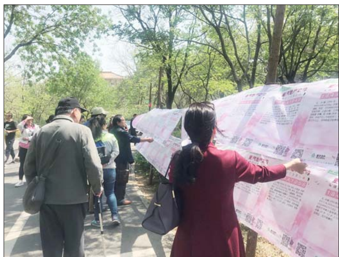
生活日报主办的“三月三千佛山相亲大会”准备好了。

本报4月17日讯 寻觅有缘人,就到千佛山。18日,作为山东公益相亲第一品牌的“三月三千佛山相亲会”将如期开幕。此次相亲会报名人数已突破了8000人,90后已然成为相亲会的主力军。届时,活动每日将超过三万人次来到现场寻觅良缘。