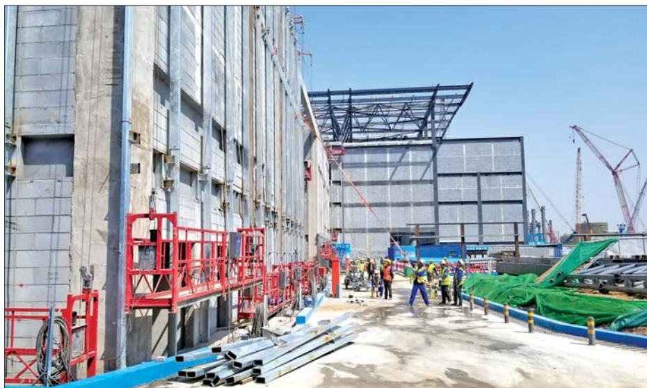
济南西部会展中心施工现场。本报记者 于悦 摄

在济南西部的日照路二环东路口,正在建设未来济南最大的会展中心,建成后的西部会展中心展厅面积将是舜耕会展中心的5倍。记者现场探访,目前项目主体的五个展馆即将封顶,整体项目将在明年5月底达到竣工验收条件。