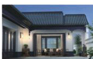
单玻筒瓦搭接版效果