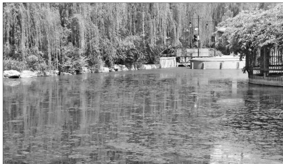
20日上午,护城河面上漂满了水藻。

据了解,藻类是一种自养型生物,没有叶绿体,但会进行光合作用,因为它的细胞里含有光合色素。春天是万物复苏、生长的季节,护城河两岸的各种植物茁壮生长的同时,由于河水清可见底,光照又好,一些栖息在湖底的藻团也得到阳光的“召唤”,撒欢儿地进行光合作用。光合作用产生的氧气会形成无数气泡,聚集在藻团之下,当达到一定数量时,底泥“拉不住”藻团,水藻便被这些泡泡托起,拱上了水面。