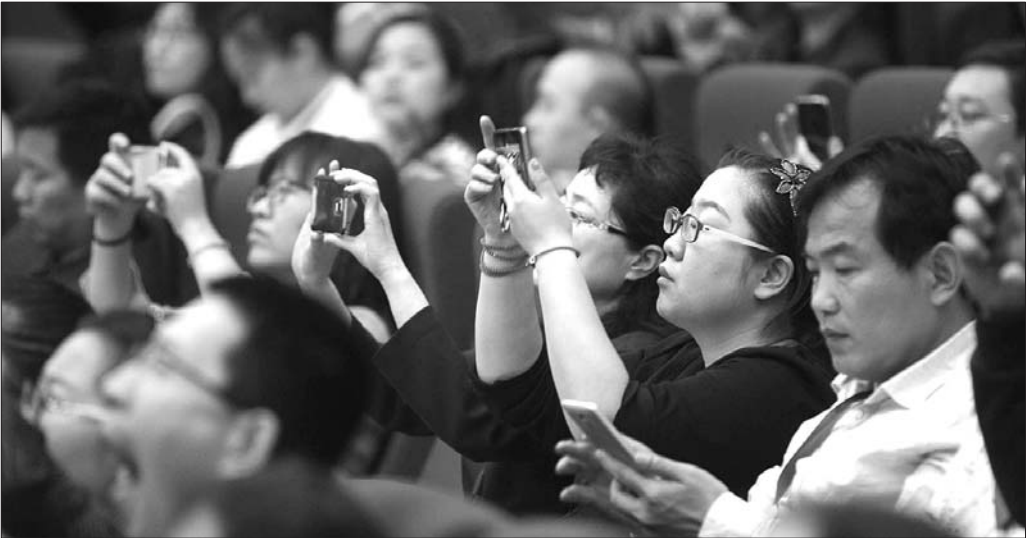
参加论坛的校长老师们纷纷用手机拍下研学产品介绍。

“齐鲁未来星”探秘齐鲁文脉研学之旅,带给孩子们的是对一个文化脉络的梳理,去探索埋藏于5A级景区之下的文化内涵。从孔庙、孔府、岱庙等建筑形制到一部建筑发展史,从儒家文化的书法、石雕、建筑等古典艺术的魅力到儒家文化在百家争鸣中的崛起。在学生