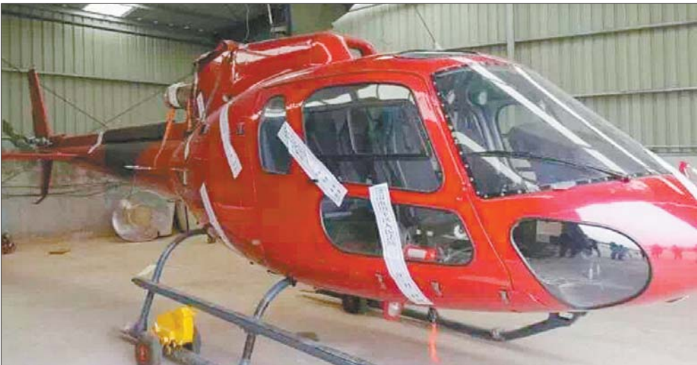
某航空公司被依法查封扣押的民用直升机。

案例进行自查自纠,充分发挥反面典型的警示教育作用。全县纪检监察组织将把查处党的十九大后仍顶风违反中央八项规定和实施细则精神问题上升到维护政治纪律和政治规矩的高度来认识,不断提高政策把握水平,坚持铁面执纪,越往后执纪越严,为全县党风政风持续好转提供坚强的纪律保证。