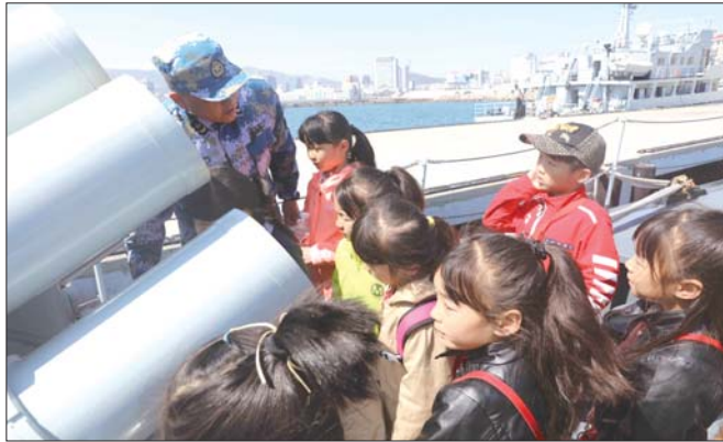
小记者登上舰艇了解武器装备性能。

活动以好奇开场,在知识中进行,以爱国精神和氛围结束。“海军叔叔们,祝你们节日快乐!”即将告别,很多小记者都依依不舍,和海军叔叔约定,“下次再见!”