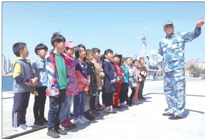
海军叔叔为小记者讲解舰艇知识。