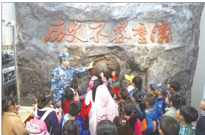
小记者参观海权文化展馆。