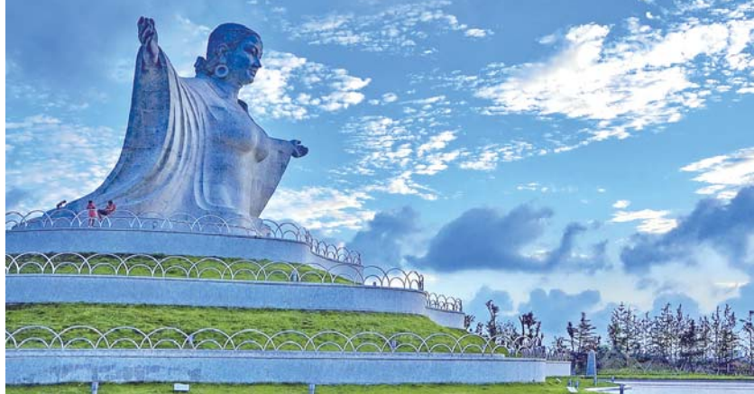
《母爱如天》 姜自立 2012年8月4日 乳山母爱文化广场