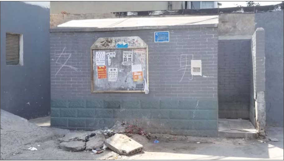
▲天桥区明园小区旁的公厕还在收费，每次5角。