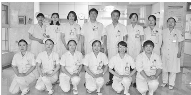
眼表与角膜病护理团队用行动诠释光明真谛。

住院斜视矫正患者,大多数以学龄前孩子为主,患儿年龄较小,入院后对陌生的环境易产生害怕,常表现为不合作或拒绝治疗,护士在工作中采