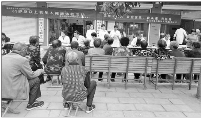
一大早查体现场就排起了长龙。

为进一步深化医改,转变医疗卫生服务模式和服务理念,构建新型和谐医患关系,充分发挥村卫生室和相公庄街道社区卫生服务中心(以下简称中心)在三级医疗卫生体系中的网底功能和“健康守门人”作用,引导辖区居民到中心(村卫生室)就诊,促进基层首诊、分级诊疗、双向转诊、有序就医格局的形成。