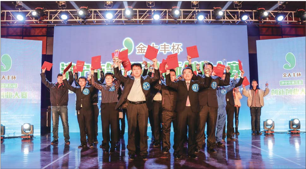
济宁市第五届创新创业大赛获奖选手们合影留念。

16日上午,在山东省乐得仕软木发展有限公司车间内一片繁忙的景象,在济宁市第五届创新创业大赛上,乐得仕公司凭借“可再生栓皮栎树皮研发生产非织造布”项目,夺得成长组的一等奖受到各方的关注。“我们参赛的可用再生栓皮栎树皮研发软木非织造布项目,现在已经取得来自日本、俄罗斯等国家的预订单。”山东乐得仕软木公司总经理刘宝宣告记者,参加创新创业大赛获得一等奖后,很多媒体进行了专题报道,既宣传了软木又扩大了企业的知名度,获得了济宁市惠达财丰创业投资有限公司的风险投资。另外还获得了大赛组委会赛前给予的相应政策支持和奖励,“如果我们没有参加大赛,这种机会是很难获得的,所以我们也希望能有更多的种子项目脱颖而出。” 珞石(山东)智能科技有限公司,是集工业机器人的生产、组装、测试、售后与集成于一体的机器人综合生产企业,凭借“轻型高精度6轴工业机器人”项目,获得济宁市第五届创新创业大赛初创组的一等奖。参加大赛后,经过第三轮融资,该公司共获得6000万的资金注入,2017年的销售额达到了3000万,作为一家初创型公司,2017年第一年面向市