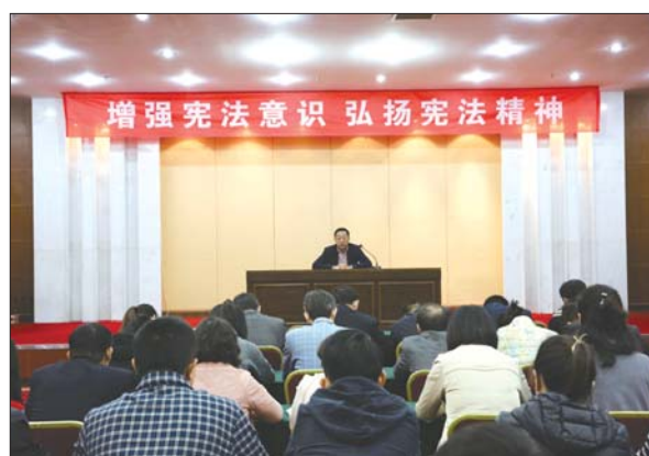
群众性学习宣传,扩大普法宣传的影响力和覆盖面,为法治银滩建设作出应有的贡献。

活动要求,全体党员干部职工要从政治和全局高度深刻认识宪法修改的重大意义,提高政治站位,牢固树立“四个意识”,坚定“四个自信”,自觉做到“四个服从”,坚定不移维护宪法作为根本法的权威地位,切实保证宪法实施。各党员干部职工特别是领导干部要带头学法用法,带头遵纪守法,依法用权,依法行政,成为运用法治思维推动改革发展稳定的先行者。还要广泛开展普法宣传教育,积极组织好