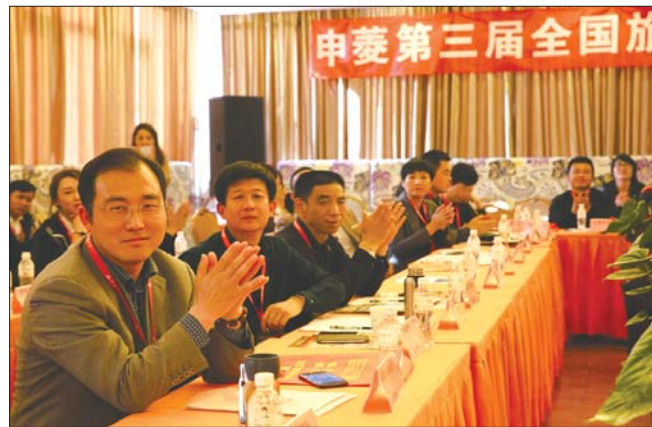
假和养生等资源,为老年人提供舒适自在的晚年生活同时,也推动了区域健康产业发展。

近几年,旅居养生作为一种新兴的养生方式,正日益被更多的老年人所接受。与普通旅游的走马观花、行程匆匆不同,选择旅居养生的老年人,一般会在一个地方住上十天半个月甚至数月,慢游细品,以达到健康养生、开阔视野的目的。旅居养生机构,在整合全国旅游、度