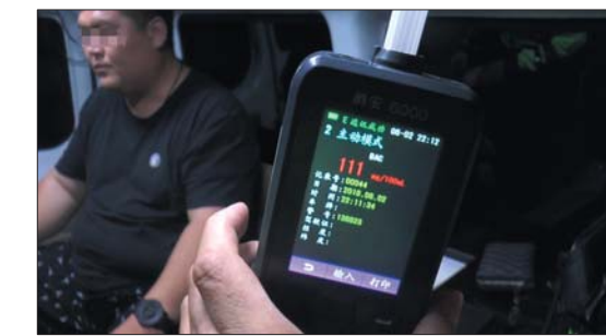
其中一名酒司机被查。 视频截图

检查,果然司机涉嫌酒驾,而且他也承认自己喝了四五瓶啤酒。可他在警车上测试,发现有人拍照时竟然不好意思了。有围观市民说,怕丢人早干吗去了。男子的呼气值为111,涉嫌醉驾。