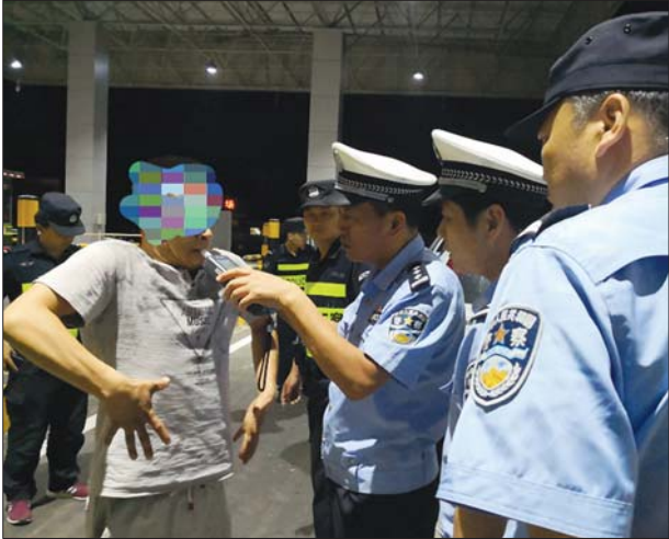
上演“花式吹气”的男子。

示超过酒驾含量100mg/100ml以上,在其长时间不配合交警测试执法,测不出最终结果的情况下,交警将该驾驶人强制带至医疗机构进行抽血检验后经