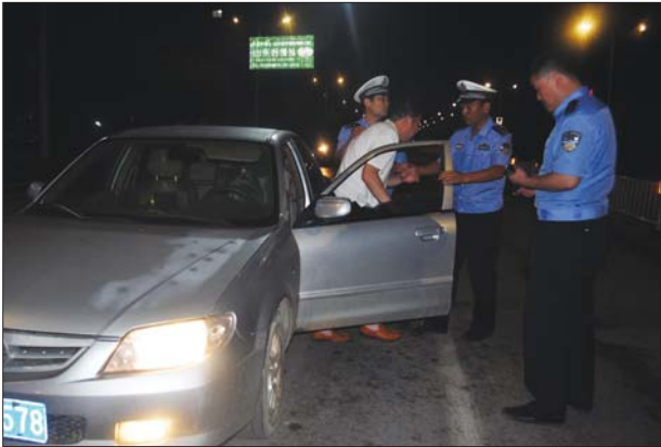
高呼为交警点赞的醉驾男子。

道路交通事故,正在救助受伤群众时,突然听见有人高呼“为交警点赞”、“为交警点赞”,且声音有些沙哑。这时,一位民警循声望去,发现一名小型汽车驾驶人把头 and 手伸出车外,做出点赞的手势。具有工作多年、职业敏感的民警发觉这名驾驶人非同寻常。于是,民警快速走到该男子车旁了解情况。当民警一靠近驾驶员时,就闻到一股刺鼻的酒味,并且发现该男子满面通红,神智不清。民警怀疑,该驾驶人可能涉嫌酒驾。于是,从警车上拿出酒精测试仪,示意该驾驶人靠边停车接受检查。结果,经现场呼气检测,其血液中酒精含量为194mg/100ml,已达到醉驾标准的2倍以上。该男子