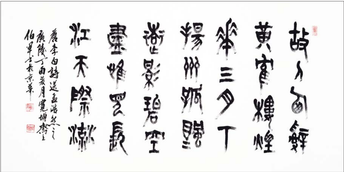
▲李白诗-送孟浩然之广陵 68x136cm