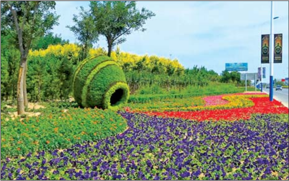
商河县道路两侧非常美观。