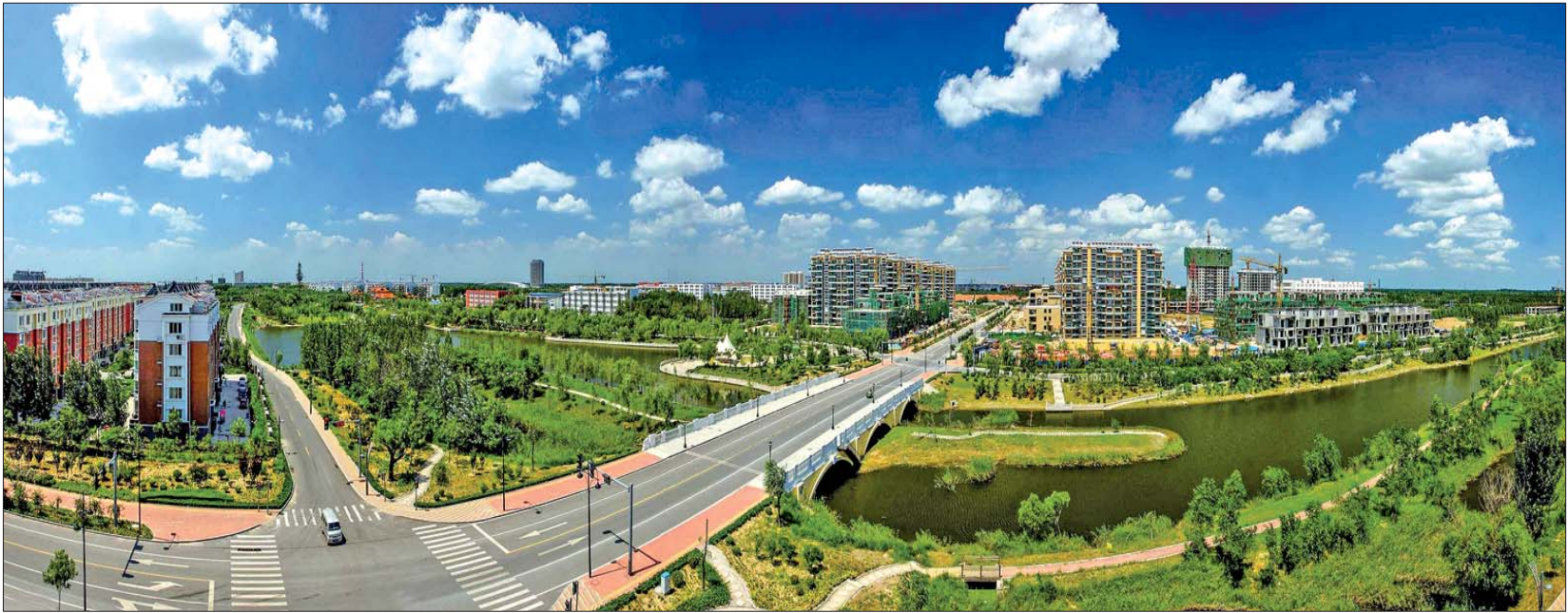
蓝天下的商河县城一角。