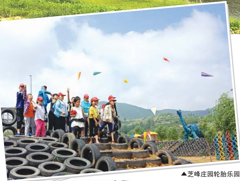
▲芝峰庄园轮胎乐园