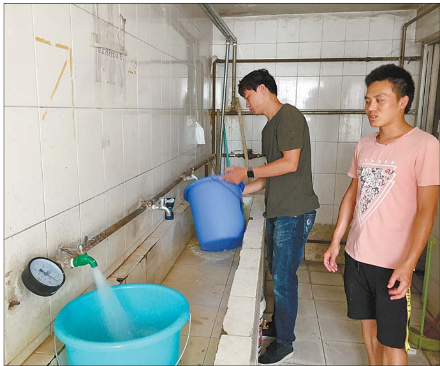
两名租住的小伙从附近小区的公厕接水。

7月即将迎来三伏天,天气一天比一天热,然而,就在夏季急需用水之时,解放东路65号居民楼60户居民家里频繁停水,常常一停就是数天,给居民生活带来极大不便。事情起因,是居民楼去年亏损了6万元水费。