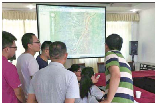
工作人员对照奥维地图查找污染源单位疑似点。

6月30日至7月1日,济南市污染普查办公室工作人员先后对本县崔寨街道、济北街道污染源普查清查建库质量进行了核查与评估。检查期间,普查办工作人员陪同市普查办检查小组对照奥维地图查找污染源单位疑似点,现场查看企业状态,确认基本普查名录信息是否完整准确。