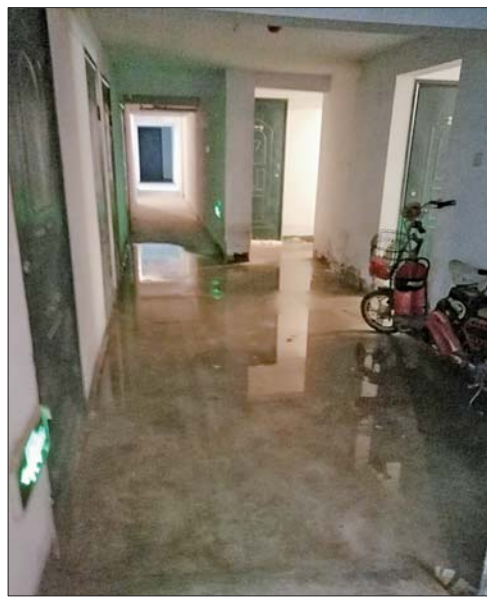
地下室也出现渗水。