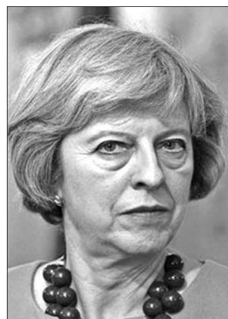
英国首相特雷莎·梅