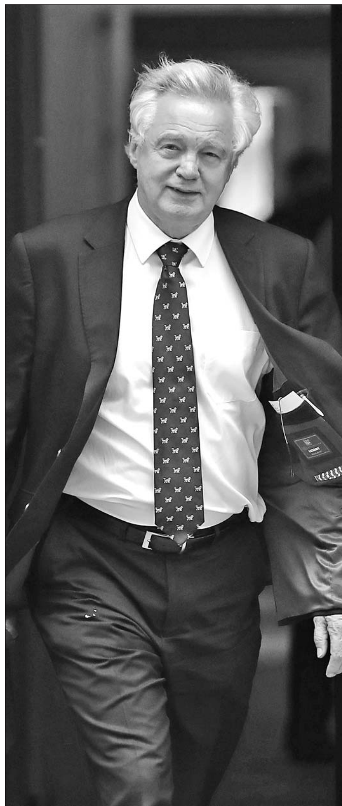
8日宣布辞去英国“脱欧”事务大臣一职的戴维斯