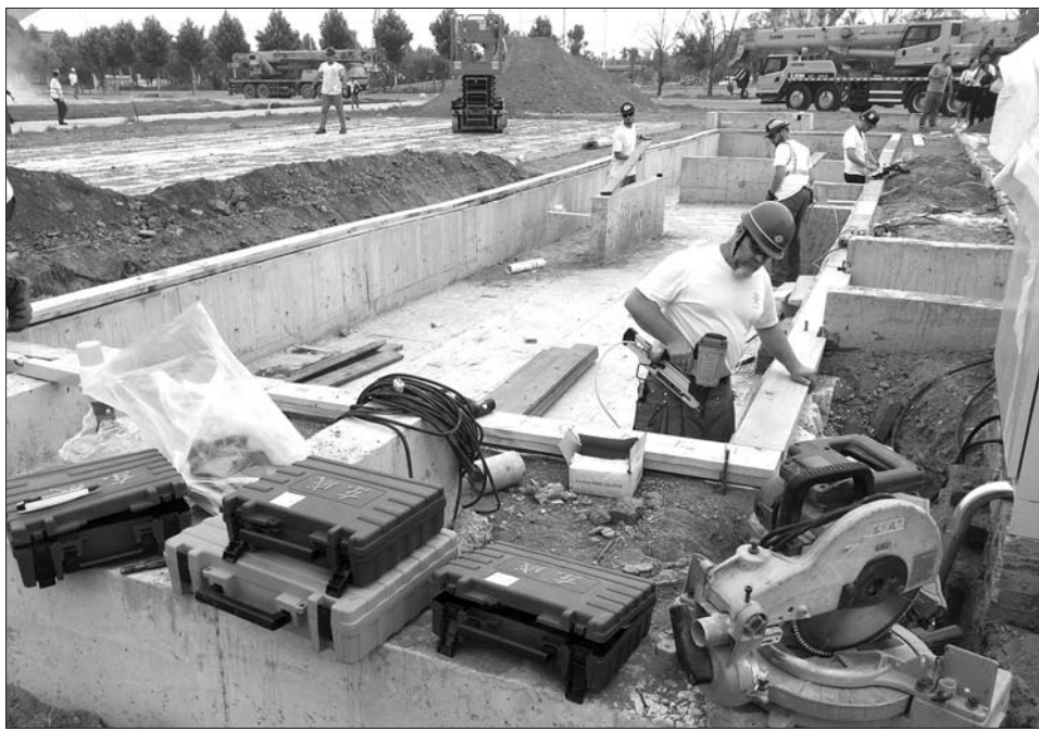
正在施工组建的蒙特利尔队。

本报7月9日讯(记者 龙帅) 7月9日,2018年中国际太阳能十项全能竞赛赛队搭建开工仪式在德州小镇举行。仪式后,来自加拿大的蒙特利尔队在竞赛场地开始了参赛作品建造。据了解,蒙特利尔队带来的是——一座高性能、净零能耗的住宅。