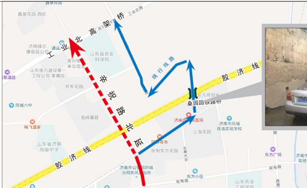
辛祝路北延搁置十年,附近居民从桑园路铁路桥下绕行多有不便。

今年上半年,有市民向历城区委书记吴承丙邮箱发消息咨询,辛祝路北延2008年就立项了,已经喊了10年了,为何没动工。该市民不久获得了如下回复:因辛祝路北延需要横跨铁路,年初铁路部门拿出国家级专业鉴定,此处不允许下穿和高架,因此,工程已经取消。