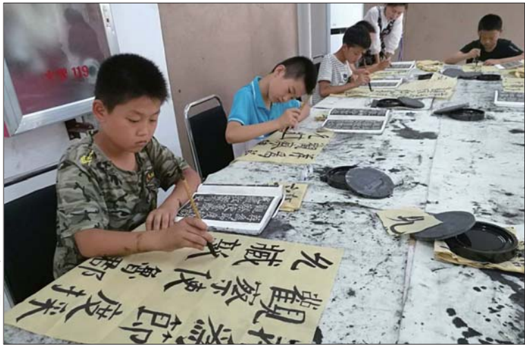
公益培训班上,孩子们在练习书法。

本报济宁7月25日讯(通讯员 王超 记者 姬生辉 周伟佳) 为了丰富暑期生活,提高广大青少年的艺体水平和生存能力,连日来,金乡县多种公益培训班相继开班,受到了广大学生和家长的普遍欢迎。