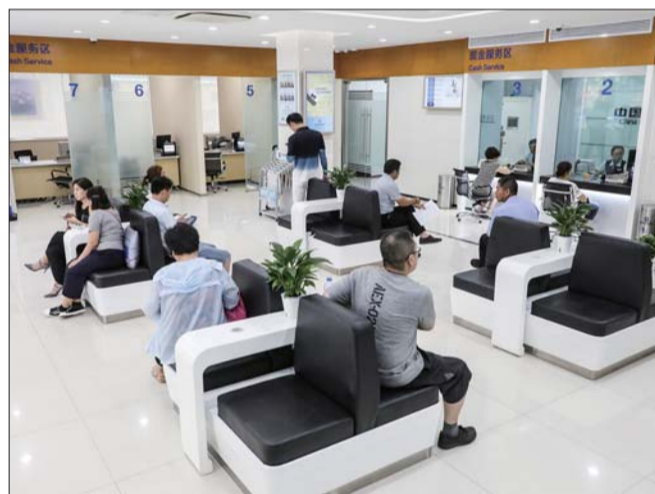
宽敞整洁的服务大厅。

此外,为有效提高公众金融知识水平和风险防范意识,保护消费者权益,该支行充分发挥党员先锋模范带头作用,专门成立金融服务工作组,把“两学一做”精神运用到普惠金融工作中,积极走进社区、学校、医院、企业,参与组织普法宣传、反假币宣传、征信知识宣传、互联网金融宣传、警惕非法融资宣传等活动,举办理财知识讲座,指导大众理性投资,用实际行动践行社会责任。