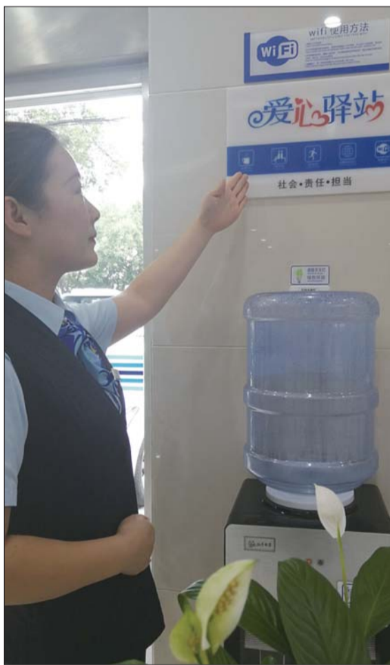
爱心驿站为户外工作者提供免费饮水、临时休息等爱心服务。

诗情画意的环境、炫酷的智能服务区、专门的消费者权益保护工作站、开放的爱心驿站、甜美的微笑服务……坐落在千年古槐旁的建行济宁古槐路支行坚持打造“槐”文化服务内涵:“同根同心,你我共进”,推出了待人诚心、服务热心、办事细心、解读耐心、永葆爱心“五心服务法”,汇聚成“有温度”的匠心服务品牌。