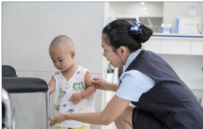
小朋友,阿姨陪你玩。