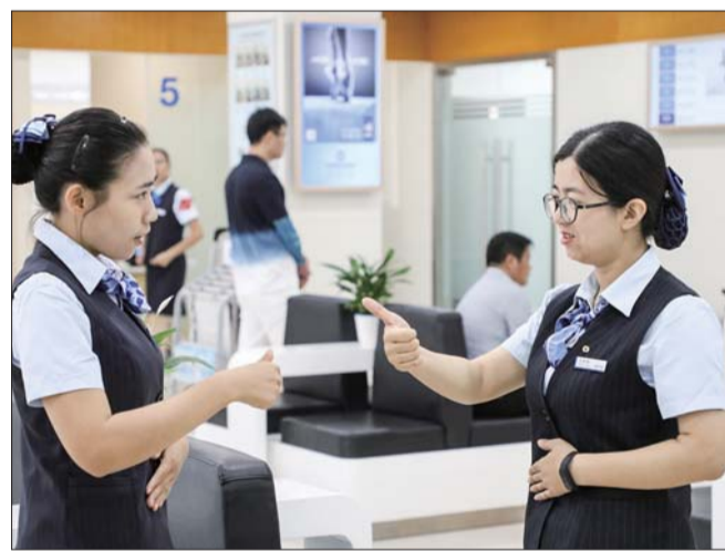
两名工作人员互相学习手语知识。