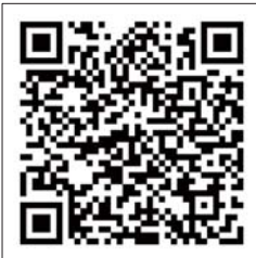
扫描二维码听专家讲座

子是否有这种问题?如果真有这种问题怎么办?8月1日上午9:30,我们邀请山东中医药大学附属眼科医院视光中心主任、山东省青少年视力低下防治中心主任孙伟做客《齐鲁微诊》,给大家进行详细解读。扫描下方二维码,报名听课,同时可以线上提问,专家将进行解答。