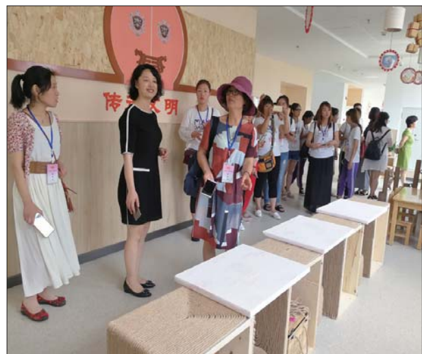
本报荣成7月30日讯(张文静) 7月18日上午,淄博市淄川区幼儿园参观团一行30多人来荣成市参观学习。参观团先后参观了第二实验幼儿园及崂江

小学幼儿园。在两所幼儿园园长的带领下,他们饶有兴致地参观了幼儿园的园所环境、文化建设、专用室建设等情况,并现场观摩了两所幼儿园的特色活动及自主游戏开展情况。对两所幼儿园典雅的园所文化、彰显特色的育人环境、鲜明的特色活动及幼儿自由轻松、专注愉悦的游戏状态给予了高度评价。对市政府高度重视学前教育发展,高点定位建设高品质幼儿园赞叹不已。参观后,她们又分别与两位园长就如何打造高品质幼儿园进行了互动交流。