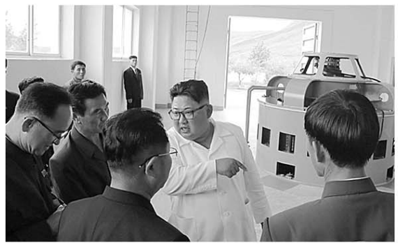
7月17日,金正恩视察渔郎川发电站建设工地。