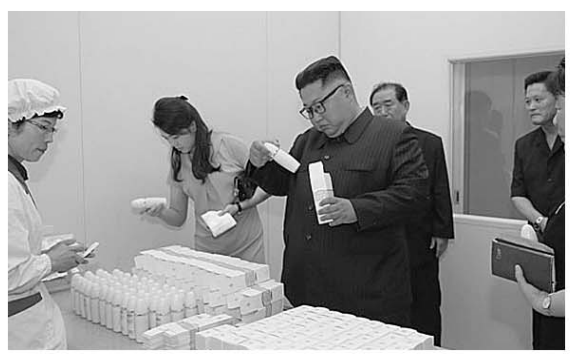
7月2日,金正恩与夫人李雪主视察新义州化妆品厂。