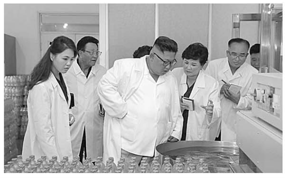
7月26日,金正恩与夫人李雪主视察松涛园综合食品厂。