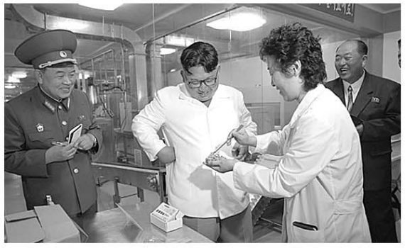
7月25日,金正恩视察朝鲜人民军第525号工厂。