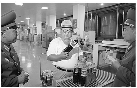
8月8日,金正恩视察金山浦海鲜酱加工厂。

别是涉及工业领域现代化改造和生产、农业领域作物产量、交通电力等民生的基础设施建设,以及东海岸地区旅游业开发和配套建设,反映出金正恩利用原有优势产业、发挥自然环境优势作为经济建设的突破口,以增强自力更生能力为核心手段,通过完善和发展解决民生基本问题的生产体系,以达到改善民生的目的。