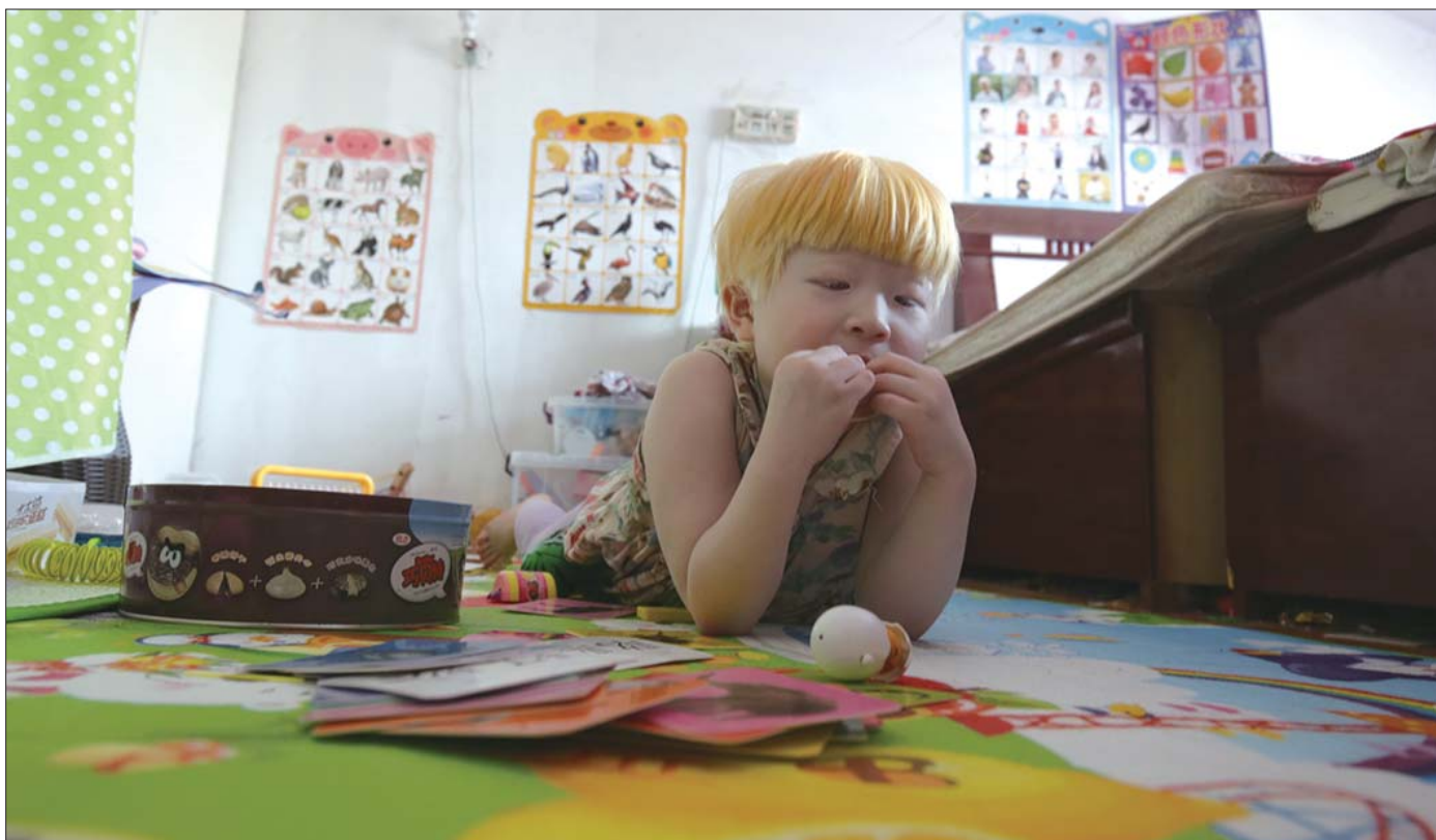
朵朵趴在地垫上,不知道在思考什么。

天热只是一个托词,更多的原因,不敢出门是怕见人。孩子因为白化病的原因,从小就没有玩伴。孩子嘴上也不说,可心里好像很懂事似的,