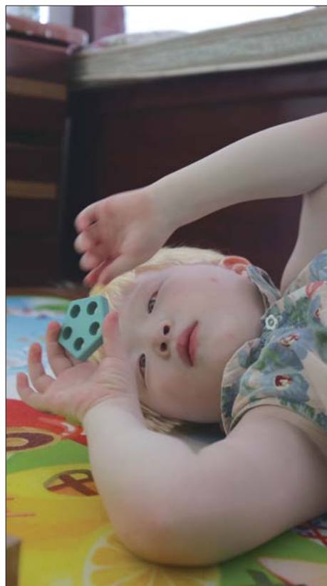
朵朵躺在地垫上自己玩耍。