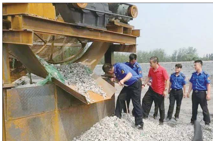
▲派驻组崔寨中队执法人员冒着酷暑将碎石网拆卸装运完毕。

当对新阳煤矿附近非法石料厂进行执法时,石料场没有一点阴凉地,派驻组崔寨中队的执法人员就冒着酷暑,全员上阵动手拆除碎石网。在高温炙烤下,历时3个小时,经过拆卸、吊装、固定等步骤,执法人员才将碎石网拆卸装运完毕。