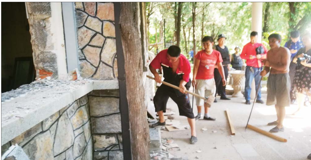
金鸡岭别墅区违建拆除现场。

在违建区域设置警戒线,从北向南3栋(处)违建同时进行拆除。伴随着拆除机械的轰鸣声,洒水车配合洒水降尘,经过几个小时奋战违建全部拆完,隐藏在周边绿林中的违建消失不见。