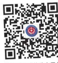
济医附院微信公众平台