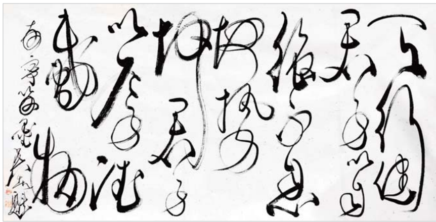
天行健,君子以自强不息