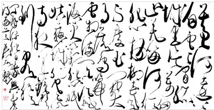
黄河远上白云间,孤城一片万仞山