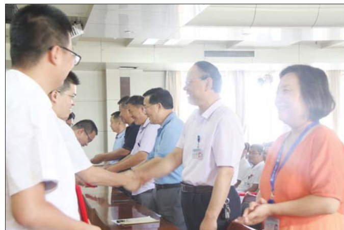
为优秀医务工作者颁发证书。

聊城市复退军人医院作为一所集优抚、医疗、保健、康复、教学、科研于一体的地市级全额优抚综合民政医院,在民政系统,全省乃至全国首家通过了“二级甲等”医院审评,被民政部评为“全国十佳医院”。医院将以树立先进典型,传递正能量,增强凝聚力,构建和谐医患关系,营造全社会尊医重卫的良好氛围为己任,努力促进医院持续稳定发展,不断提高医疗水平和医护水平,更好地为广大人民健康生活提供更优质的医疗服务。