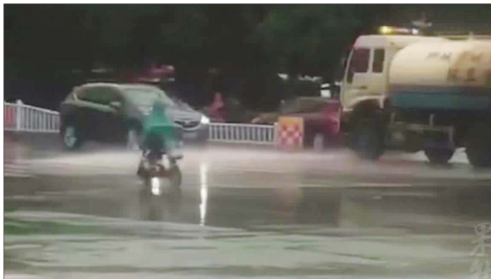
雨中,一辆洒水车在市区主干道上洒水作业。(视频截图)

本报聊城8月20日讯(记者 谢晓丽) 8月18日至19日,聊城普降大暴雨,城区多路段积水严重。一则洒水车雨天洒水的视频刷爆了朋友圈,很多市民吐槽这么大的雨洒水车还在作业,这是浪费资源。聊城市城市管理局回应,雨天地面会产生很多泥水,这个时候洒水车作业可以及时清理道路垃圾和淤泥。