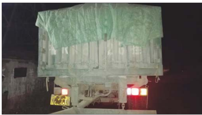
民警查处的“百吨王”。

当日凌晨2时许,东阿交警大队二中队民警在省道S105线正常巡逻时,接群众举报称省道S105线牛角店镇附近多辆重型车辆超载行驶,民警立即连夜赶到现场,采取跟踪和分段拦截的方式,对严重超载大货车进行集中查处,经